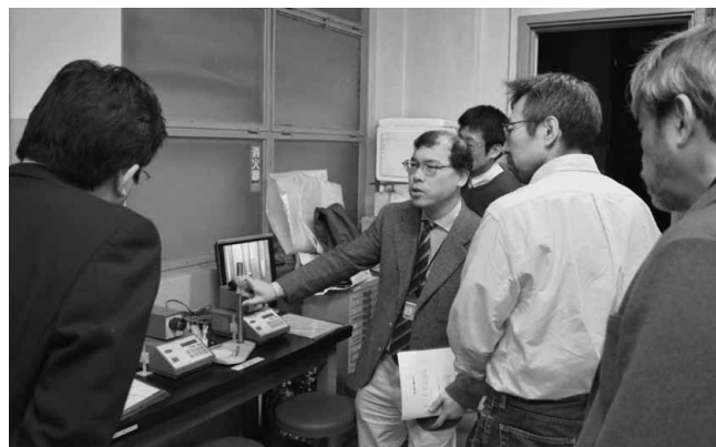
融点測定装置の説明

貫教育校の教諭たちから、このような機器があるのだという素朴な感銘の声が聞かれた。短い案内時間であったゆえ、一貫教育校の生徒たちの研究テーマに、第2校舎の研究機器をどう活用させるか迄の議論には到らなかったが、多様な研究機器があることを知って頂く良い取組みであったと思える。今後、これらの機器を写真付きでリスト化して自然セHPに掲載する手段も重要になる。