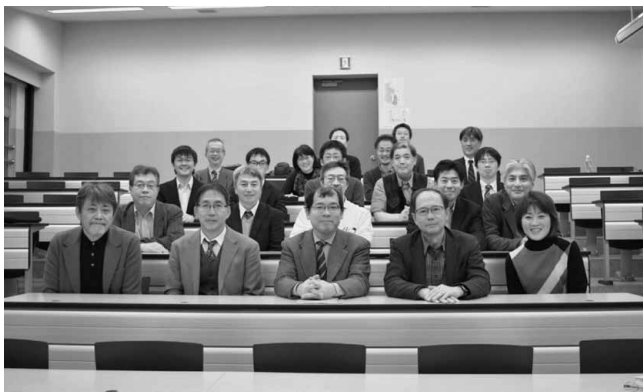
一貫教育校との連携ワークショップ参加メンバー

17：15～18：00 未来の科学者を育てるための総合討論（第1部，第2部を踏まえての将来構想や今後の展開も含めた議論）